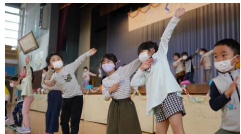
1年生を迎える会 元気いっぱいの1年生ダンス

先行き不透明な時代に生きていく子どもたちに身に付けさせたい能力の本質は、昔から変わっていません。子どもたちと一緒に「おりづる子ども会の歌」を大事にしていきます。