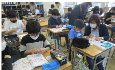
学習参観日 5年生家庭科 おうちの方と一緒に玉どめ練習中