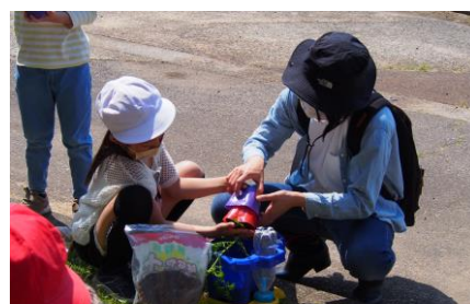
2年生 生活科 ボランティアの方と 一緒に野菜の苗うえ