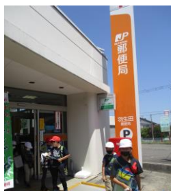
3年生 社会科「町たんけん」 羽生田郵便局を訪れました