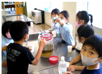
3年生 梅ジュース完成！