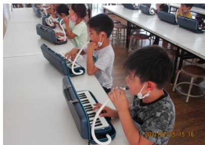
1年生 鍵盤ハーモニカ講習会